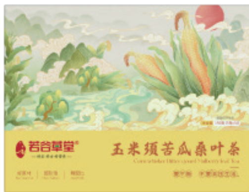
(玉米须苦瓜桑叶茶)