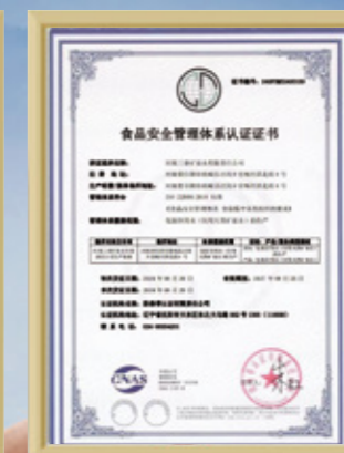
食品安全管理 体系认证证书