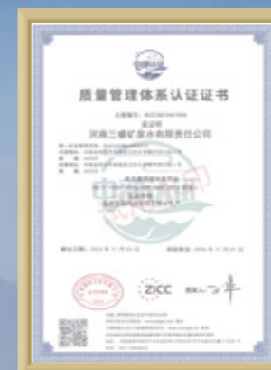
质量管理体系 认证证书