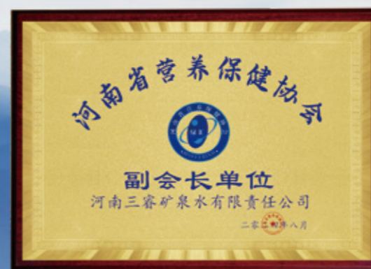
河南省营养保健协会 副会长单位