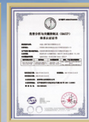
危害分析与关键控制点 (HACCP) 体系认证证书