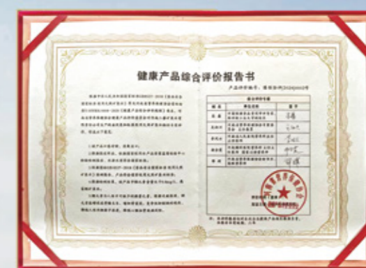
健康产品综合评价报告书