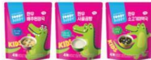
FOODY BUDDY 即食汤品