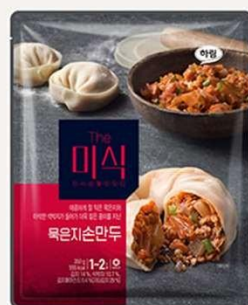
陈年泡菜 手工饺子