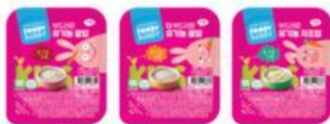
FOODY BUDDY 有机米饭