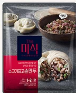
牛肉香菇 手工饺子