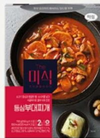
辣味牛里脊 部队锅汤