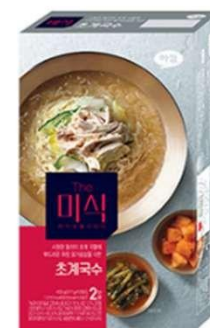
시원한 동치미 초계국물에 부드러운 하림 닭가슴살을 더한 醋香鸡汁冷面