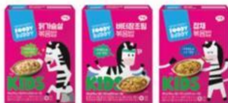
FOODY BUDDY 冷冻炒饭