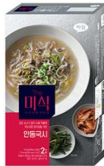
깊은 소고기 양지사골국물에 부드러운 양지살을 더한 安东式骨汤面汤