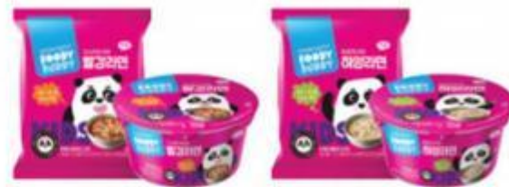
FOODY BUDDY 方便面