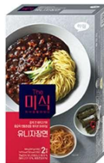
황갈색 춘장과 굵게 간 돼지고기를 볶은 오리지널 肉末炸酱面