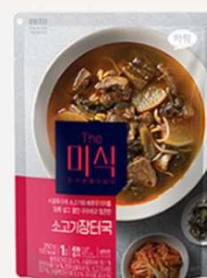
韩式乡村辣味 牛肉汤