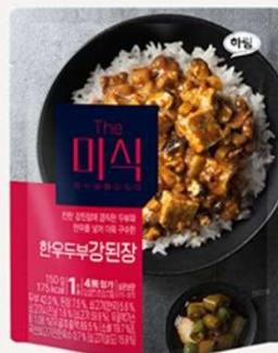
牛肉豆腐浓酱 汤酱料