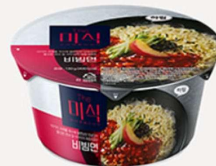
The Mi-shik 杯装拌面