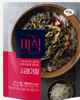
萝卜干大酱汤 酱料