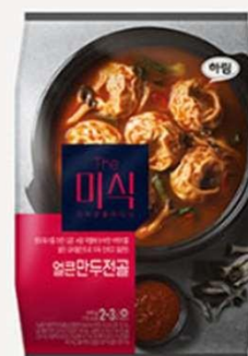
辛辣泡菜 饺子火锅