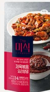
辣味炒猪肉辣椒酱