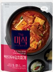
陈年泡菜 炖豆腐汤