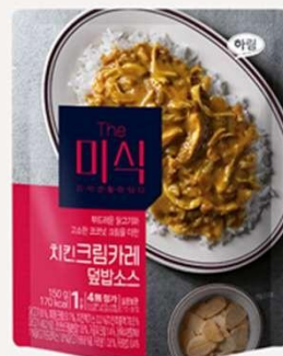
奶油鸡肉 咖喱酱料