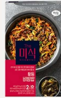
黄登式辣牛肉拌饭