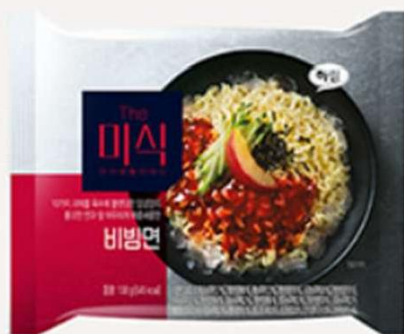
The Mi-shik 韩式拌面