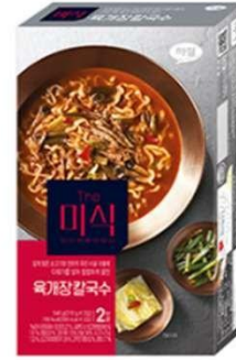
진하게 우린 사골육수에 직접 볶은 다대기를 넣어 칼칼하게 끓인 麻辣牛腩手切面汤