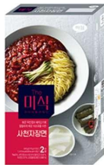
볶은 두반장과 돼지고기에 얼얼한 매운맛의 마조유로 완성한 川式麻辣炸酱面