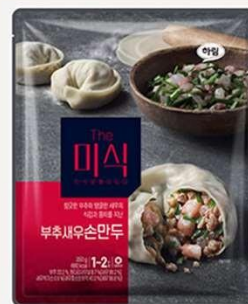
韭菜虾仁 手工饺子