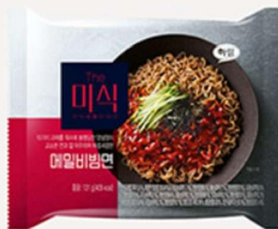
The Mi-shik 荞麦拌面