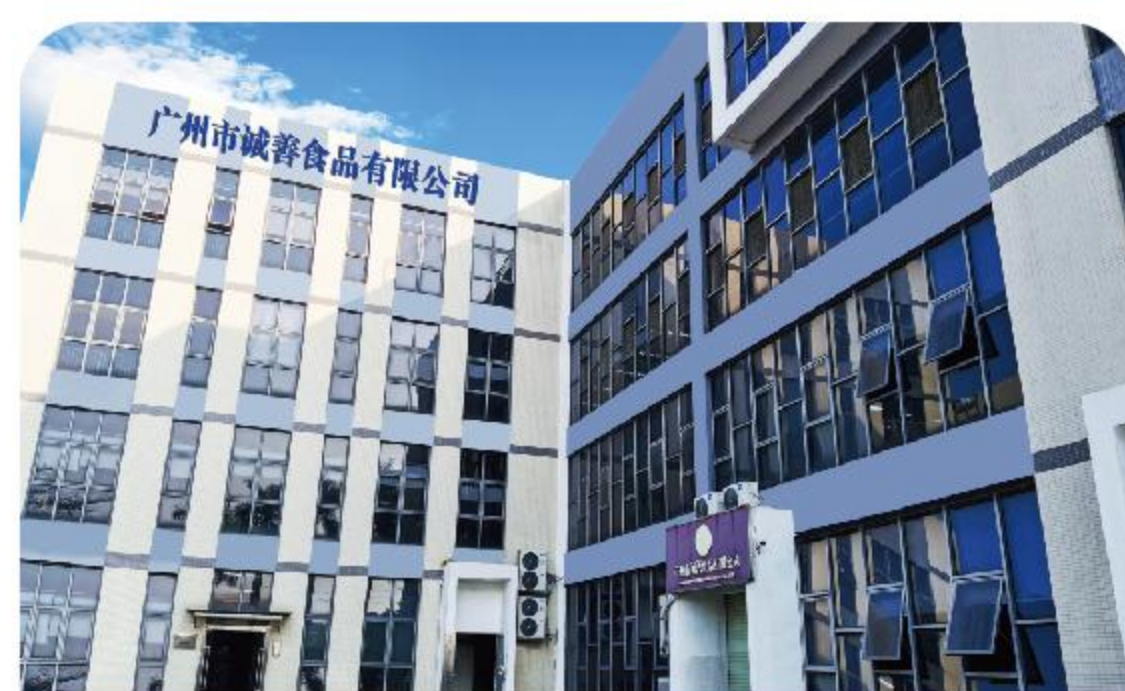
Guangzhou Chengshan Food Co., Ltd. 广州诚善食品有限公司