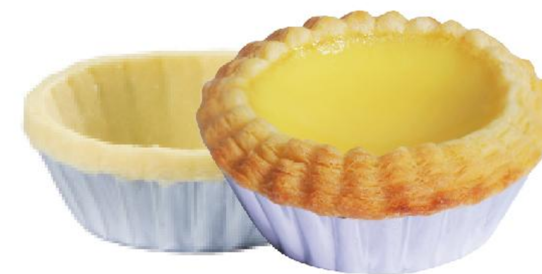
生胚尺寸约:直径6.3、高度2.3cm