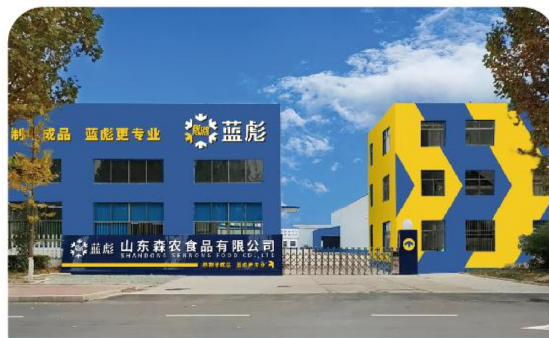
Shandong Sennong Food Co., Ltd. 山东森农食品有限公司