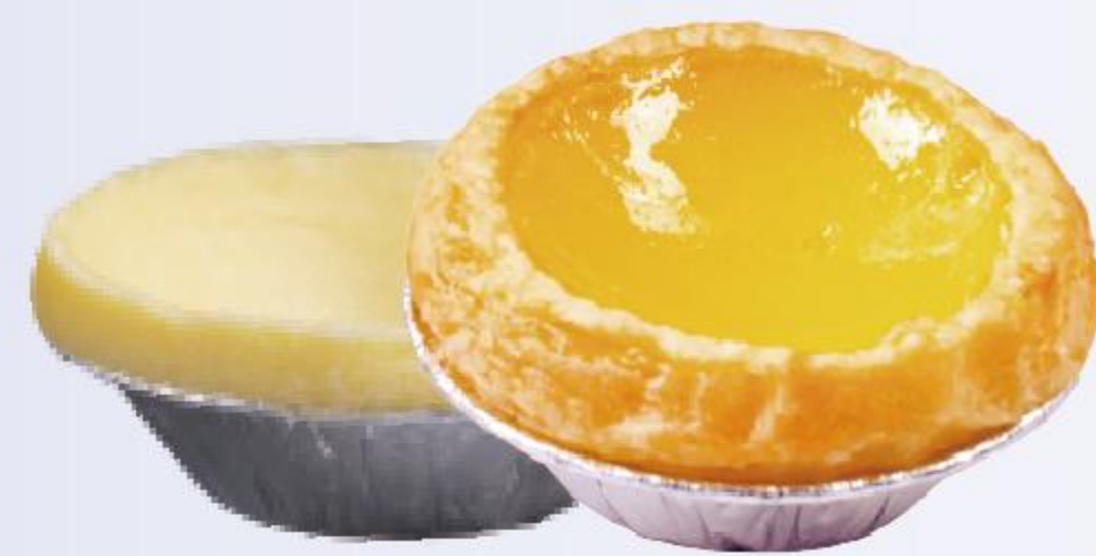
生胚尺寸约:上直径5.5cm、高2cm