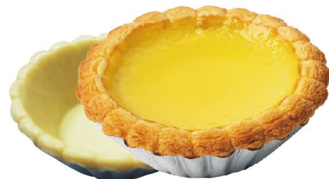
生胚尺寸约:直径8.1cm、高度2.5cm