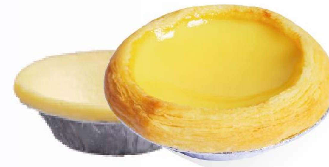
生胚尺寸约:直径7cm、高度2cm