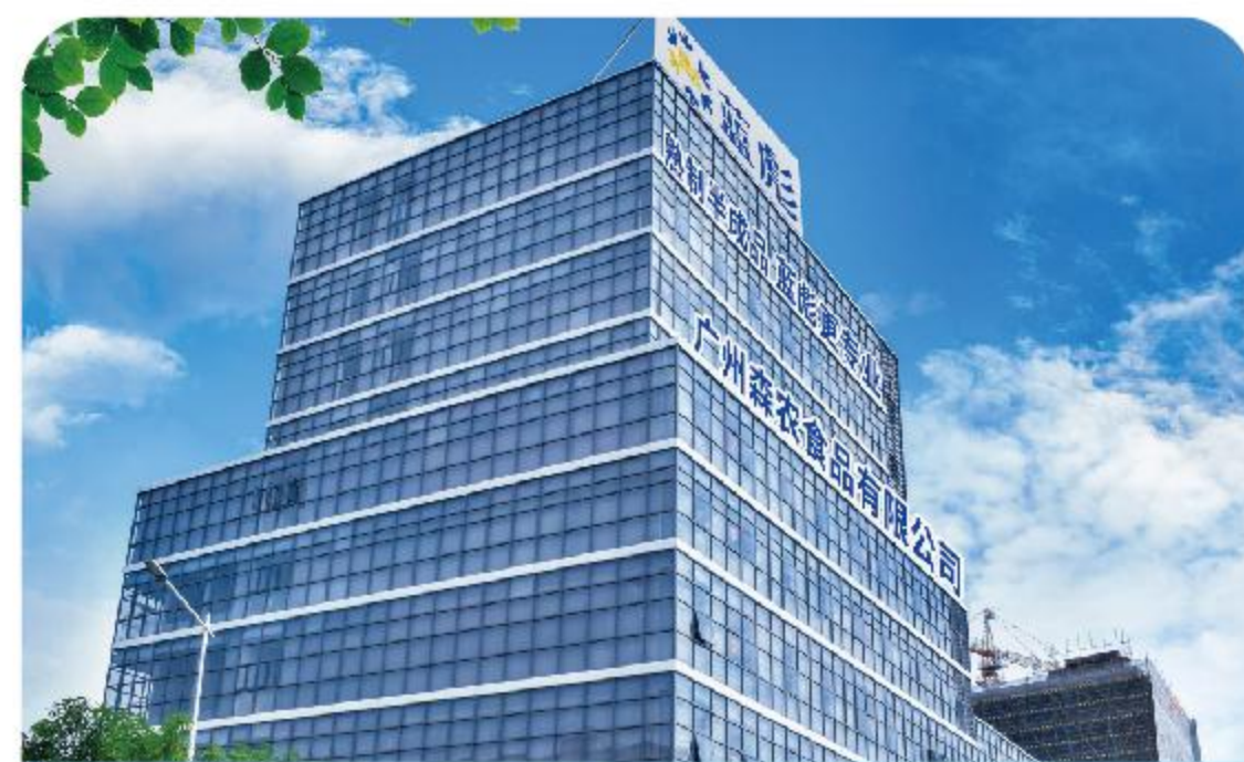
Guangzhou Sennong Food Co., Ltd. 广州森农食品有限公司