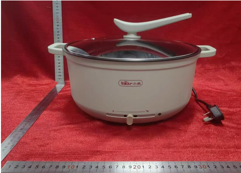
覆盖型号 DHG-J50P1 外观