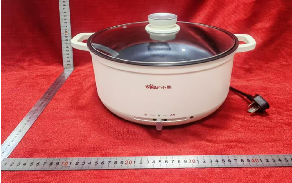
主检型号 DHG-H50K7 外观