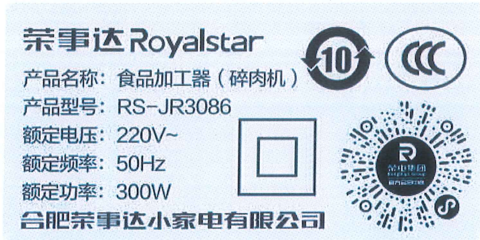
照片 01 铭牌