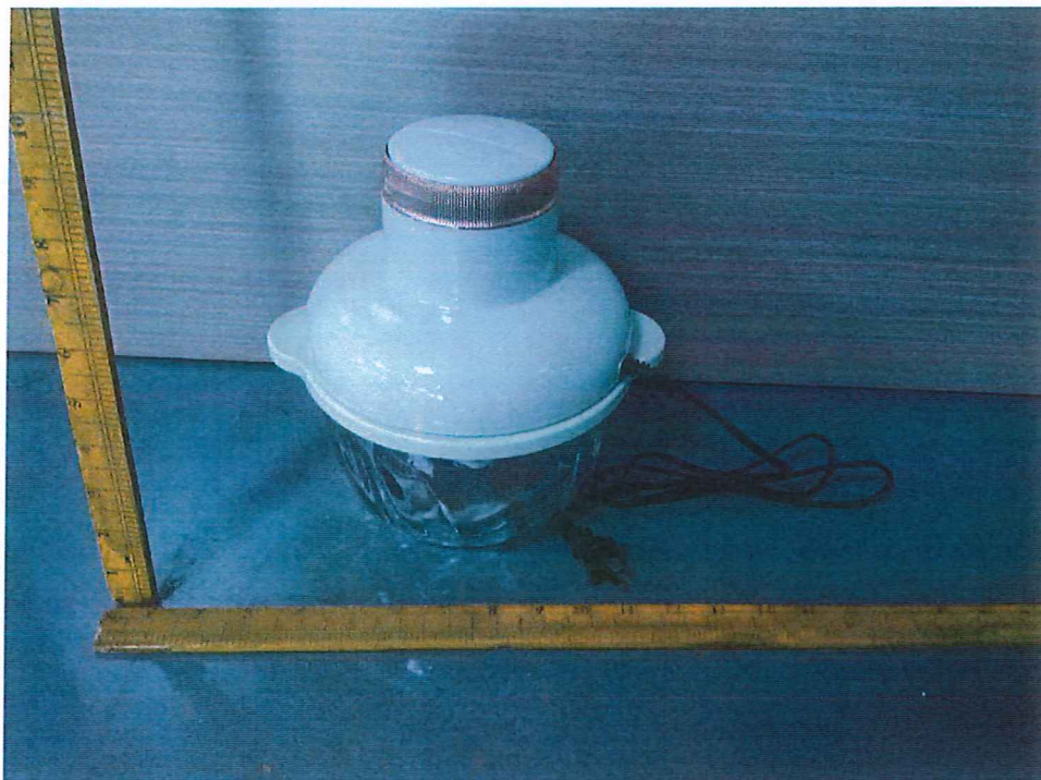
照片 02 外观