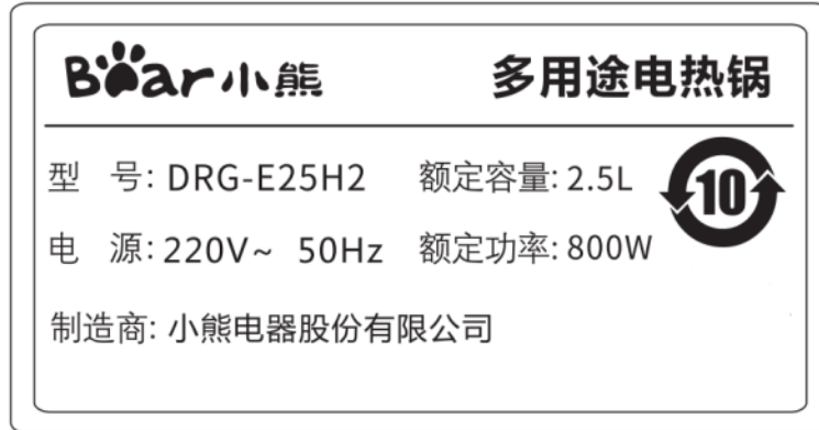
铭牌 (材质为亚银不干胶贴纸)