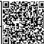
致癌芳香胺清单附表