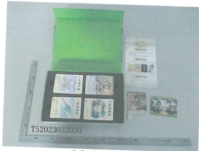
欢乐三国杀标准版