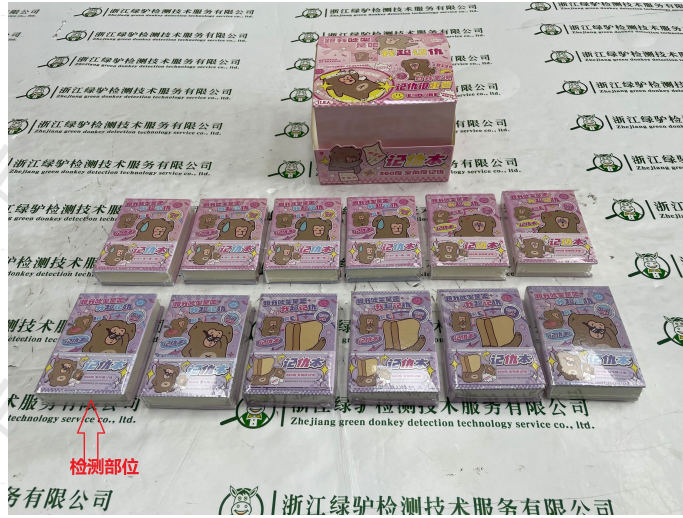
检测样品贴样 (或者照片)