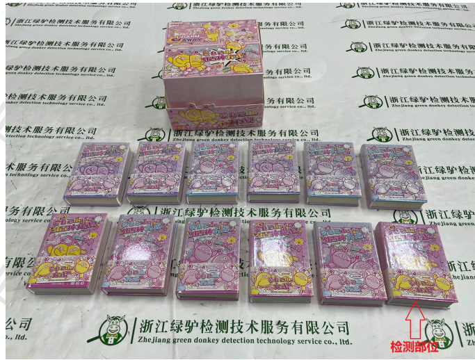
检测样品贴样 (或者照片)