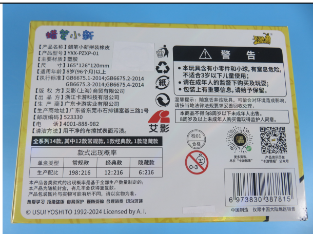
YXX-PZXP-01 的标签照片 2