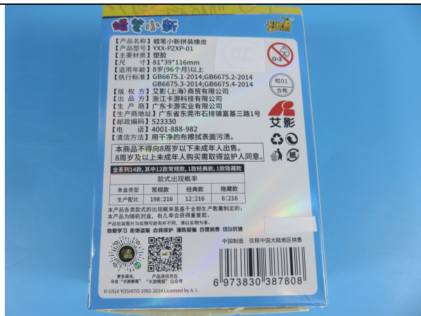
YXX-PZXP-01 的标签照片 1