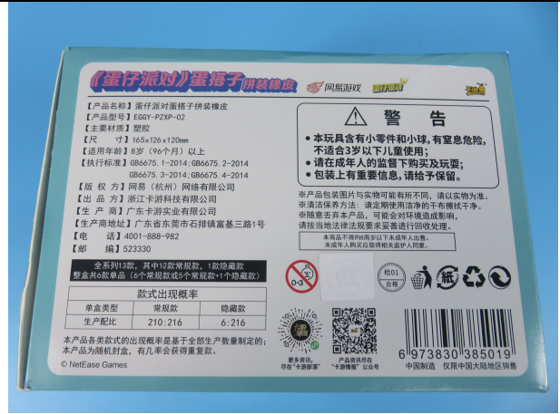
EGGY-PZXP-021 的标识照片 1