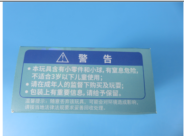
EGGY-PZXP-021 的标识照片 3