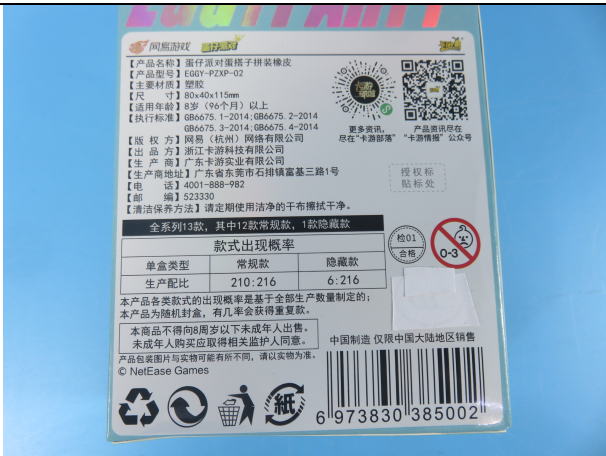
EGGY-PZXP-02 的包装袋照片 2