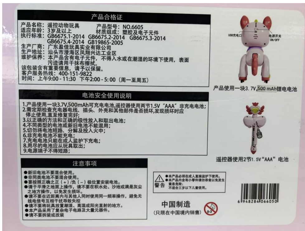
差异: NO. 6605 的标签