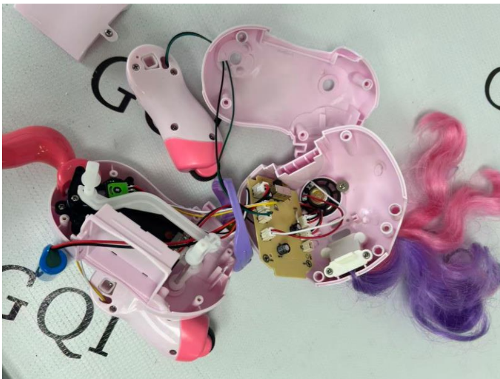
差异: NO. 6605 独角兽的内部结构图