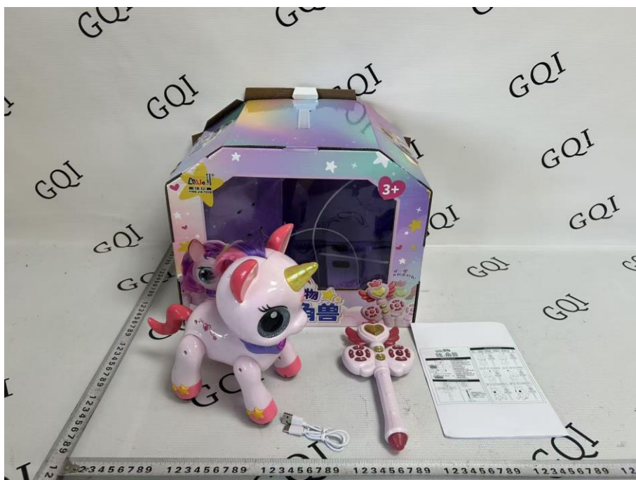
差异: NO. 6605