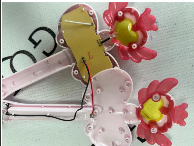
差异: NO. 6605 仙女棒的内部结构图