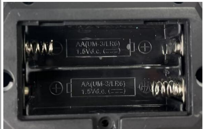
差异: 757-7008 (款式一) 的遥控器电池室图 (两个遥控器电池标识一致)