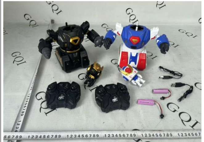
差异: 757-7008 (款式一)