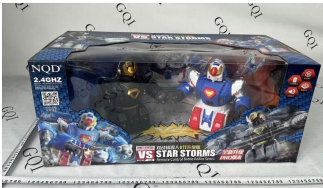
差异: 757-7008 (款式一) 外包装