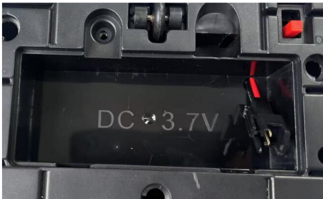
差异: 757-7008 (款式一) 的车电池室图 (两个玩具车电池标识一致)