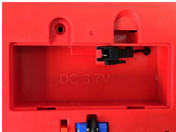
差异: 757-B067 的车电池室图 (车电池室一致)