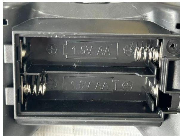
差异: 757-B067 的遥控器电池室图 (遥控器电池室一致)