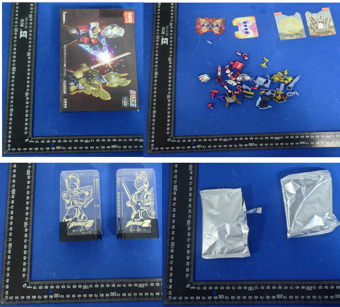
差异样品标识照片