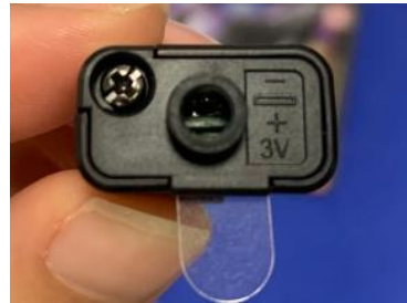
差异样品标识照片