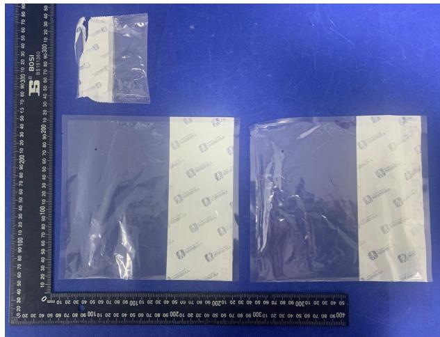
差异样品标识照片