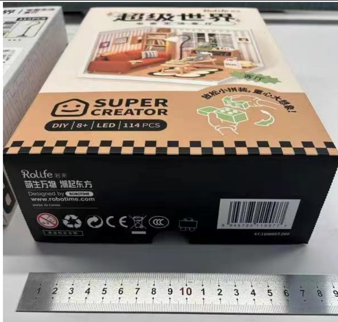
差异 2 样品照片