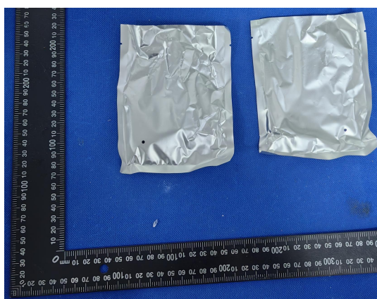
差异样品标识照片

产品名称: 布鲁可积木 产品型号: 71102 适用年龄: 10岁及以上 主要成分: ABS 塑料 执行标准: GB 6675.1-2014 GB 6675.2-2014 GB 6675.3-2014 GB 6675.4-2014 被授权商/制造商: 上海布鲁可积木科技有限公司 公司地址: 上海市闵行区田林路 1016号10幢3层 公司网址: www.bloks.com 客服电话: 4009206161 工厂名称: 昆山海汇精密制造有限公司 工厂地址: 江苏省昆山市千灯镇圣祥东路188号 本盒内含有变形金刚布鲁可积木人随机款或隐藏款