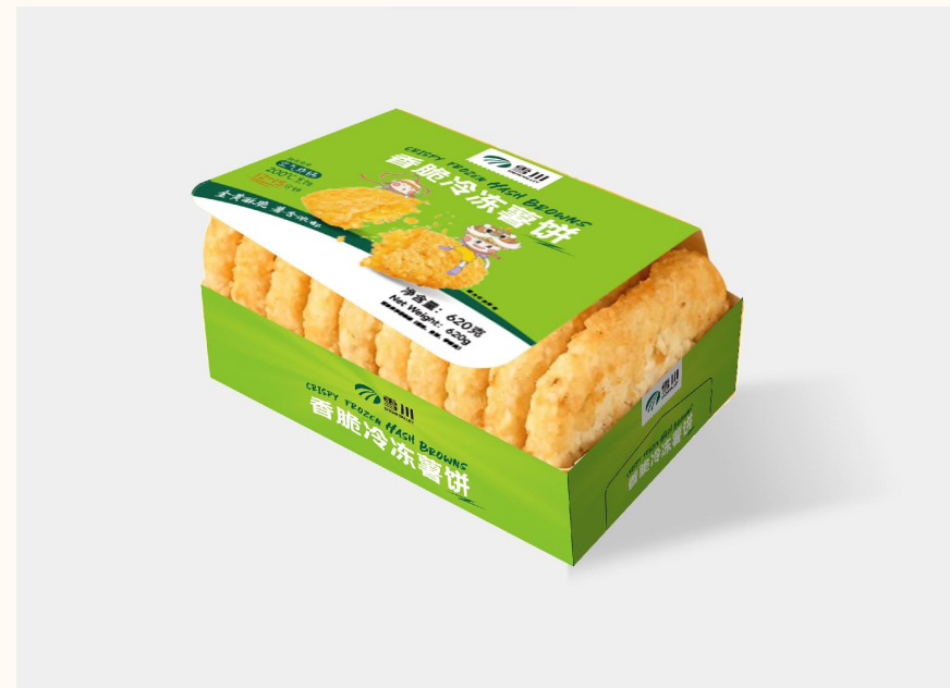
香脆里冷冻薯饼620g*24盒

专研配比，色泽金黄，咔滋一咬，酥脆爽口 品质原料还原本真味道，唇齿留香 外脆里糯，鲜香饱满薯粒带来舌尖新体验，美味过瘾