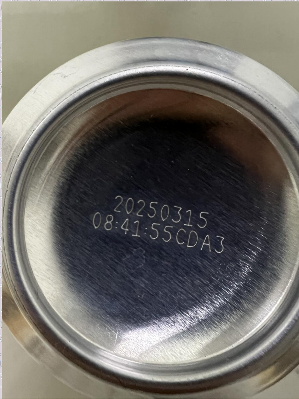
样品图片/标识内容