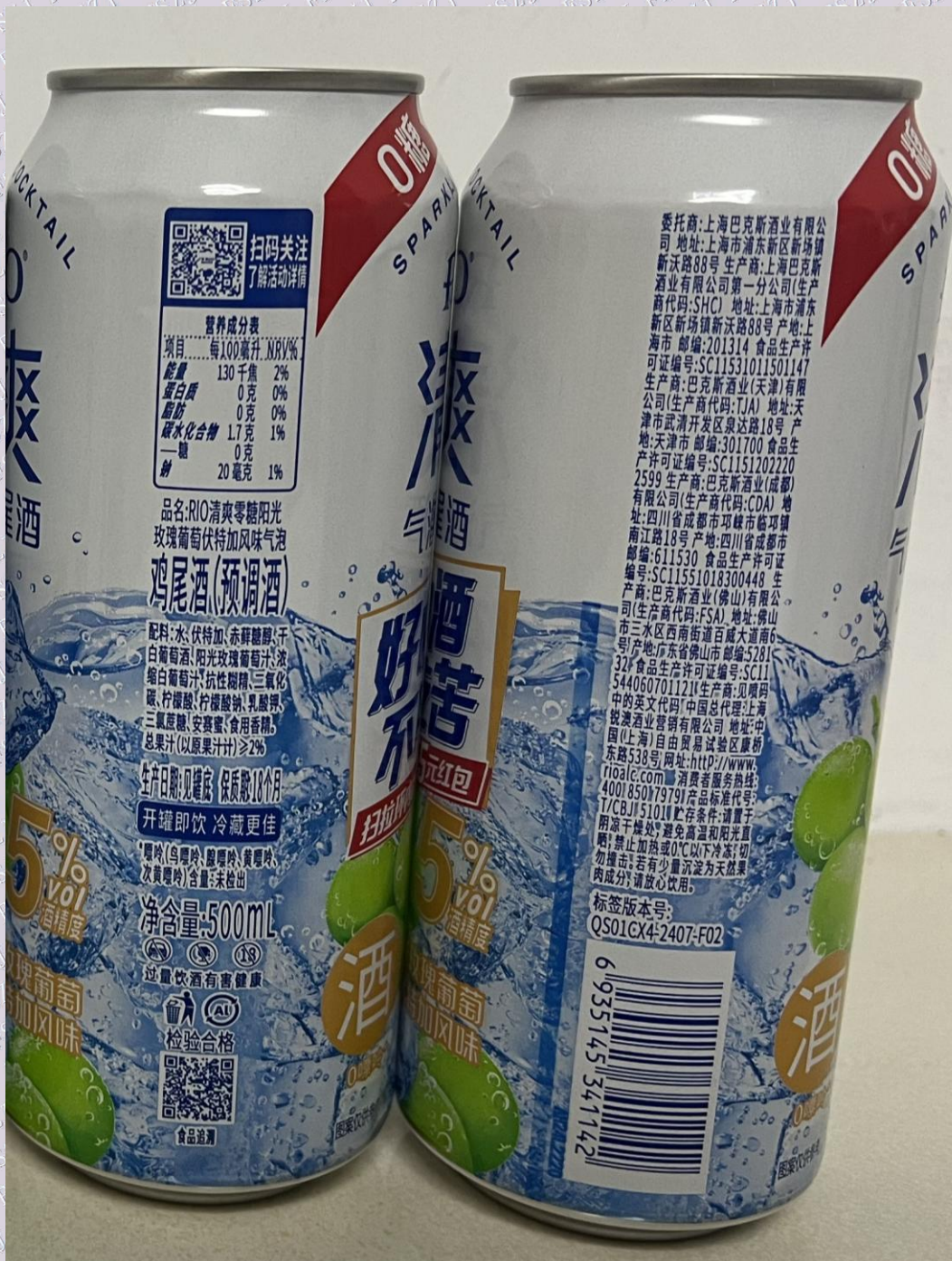
样品图片/标识内容