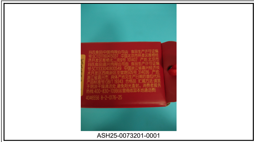
此照片仅限于随 SGS 正本报告使用