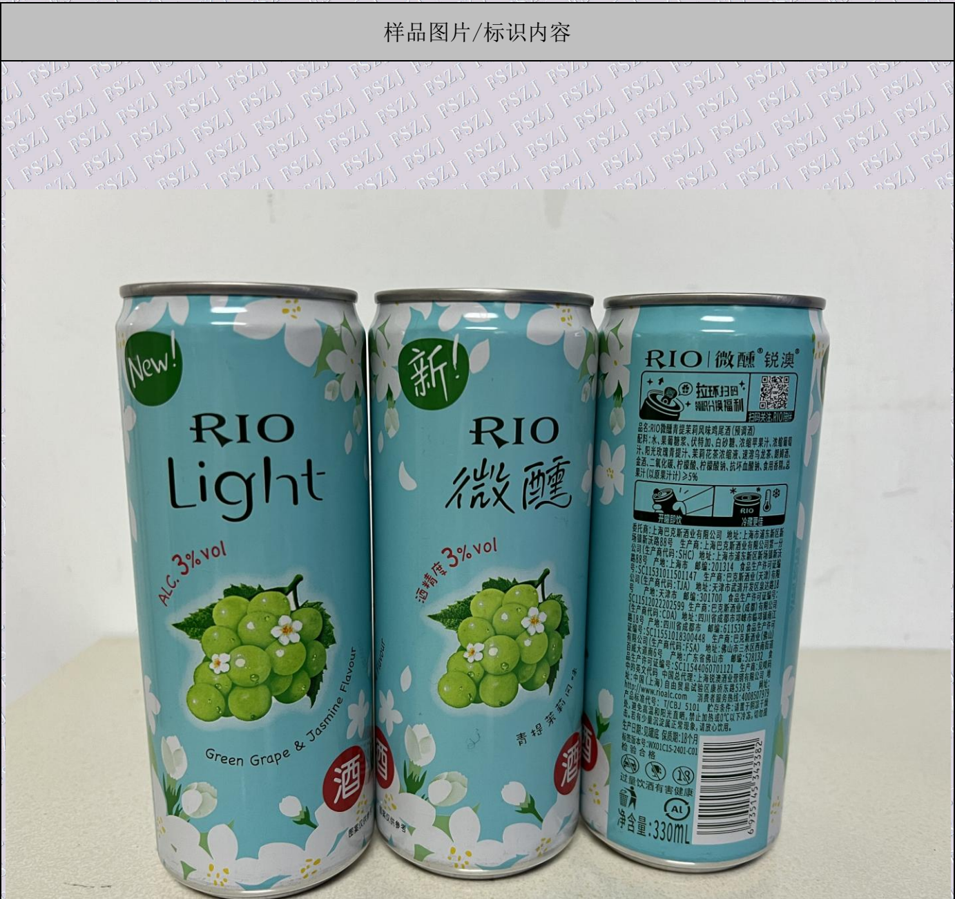
样品图片/标识内容