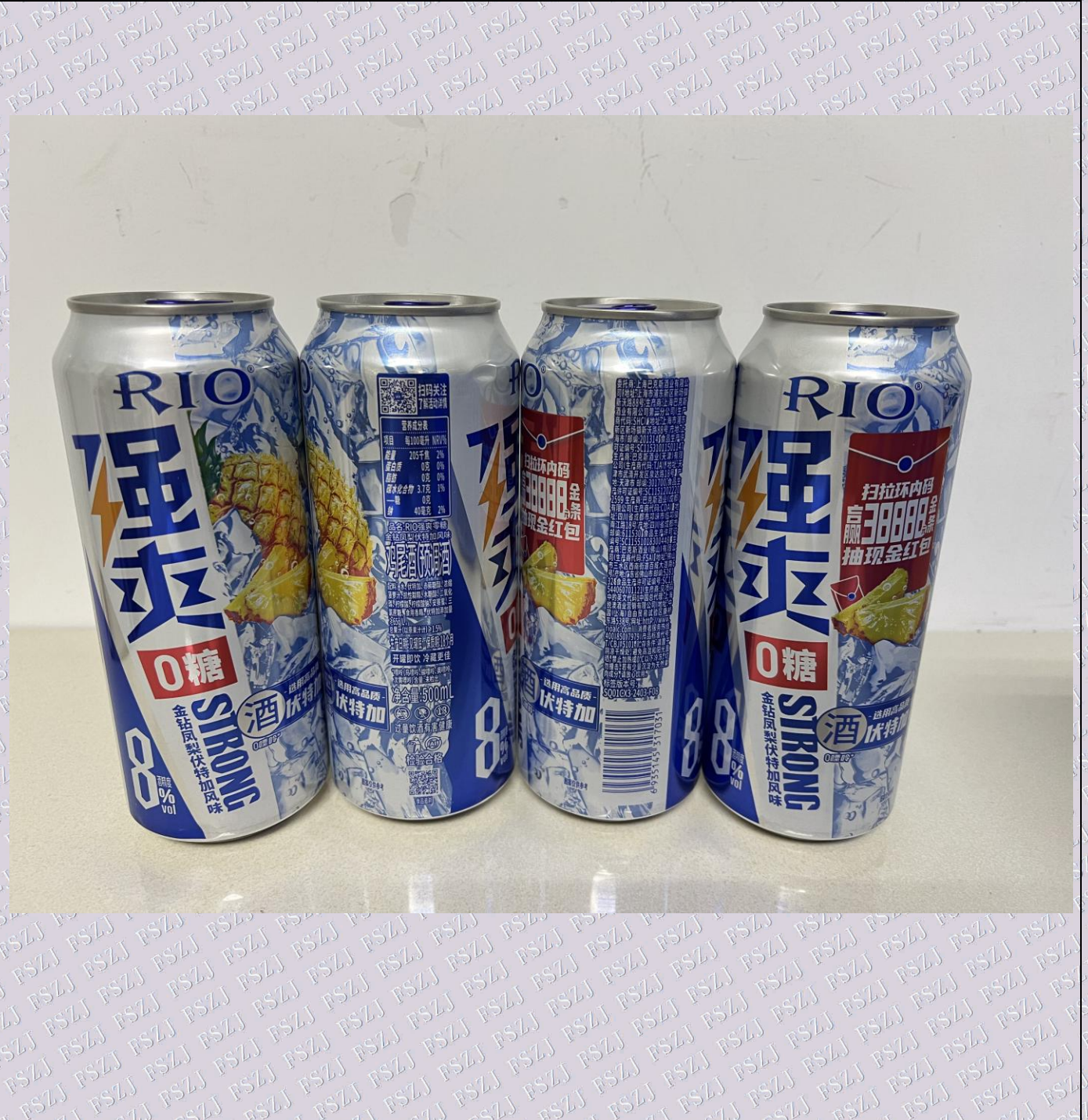
样品图片/标识内容