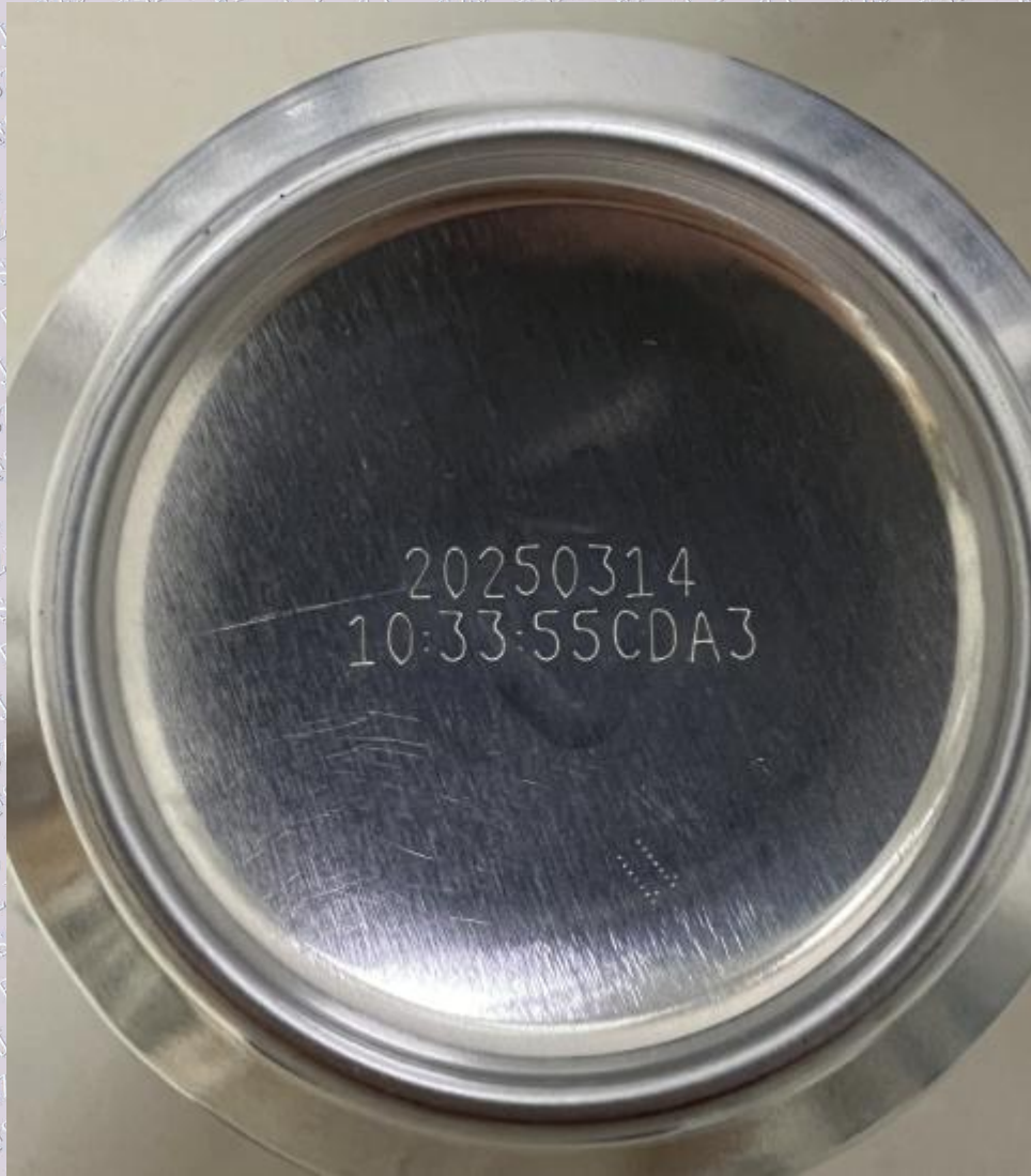
样品图片/标识内容