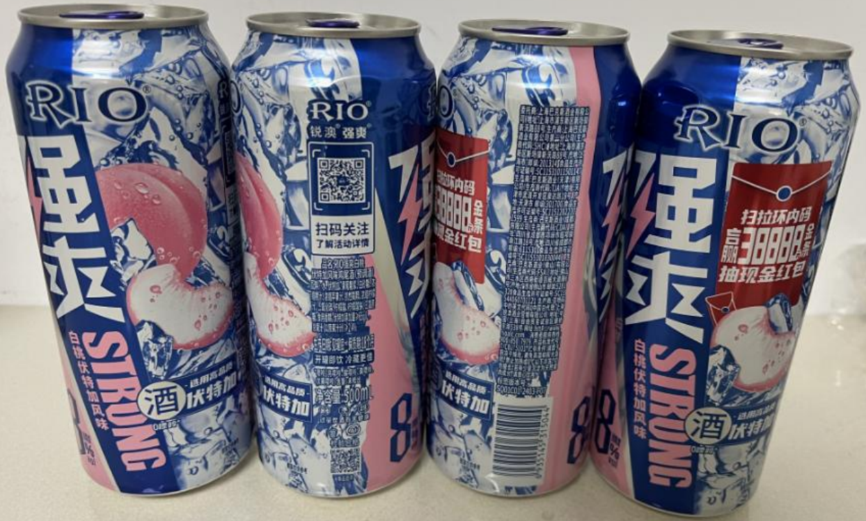
样品图片/标识内容