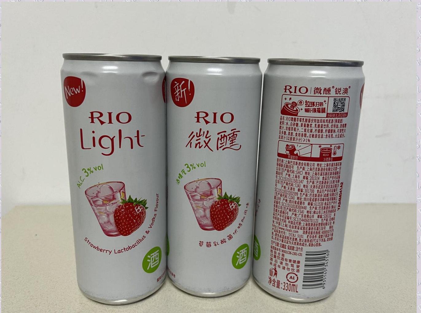
样品图片/标识内容